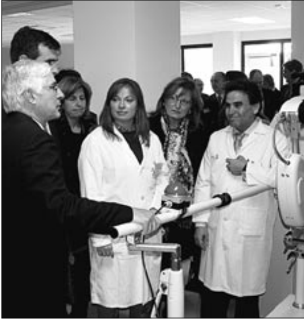
Barreda recorrió las instalaciones del complejo.