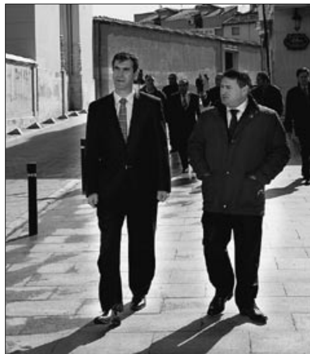
La calle La Mina cuenta con un aspecto renovado.

los trabajos de reforma integral de la plaza del Jardinillo se encuentran a punto de finalizar y ya presenta una renovada imagen, donde destaca la nueva pérgola instalada o el novedoso formato de la fuente de Neptuno. Además, ya se está procediendo a instalar mobiliario urbano en la Calle Mayor y su entorno, mientras que se confía en que la remodelación de la Plaza Mayor concluya en abril.