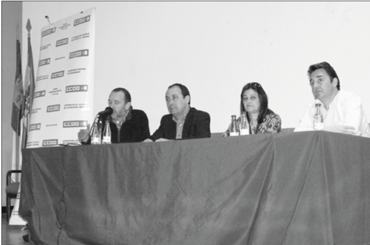
CC.OO celebró esta semana una jornada formativa sobre el acuerdo de las pensiones.